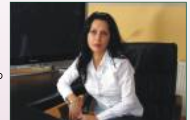
7 ani experienta in domeniul imobiliar

ARAD STR.ST.A.DOINAS 41 Tel./fax: 0257 / 271.642 Mobil: 0722.313.280 tehnocasa@tehnocasaimobiliare.ro www.tehnocasaimobiliare.ro